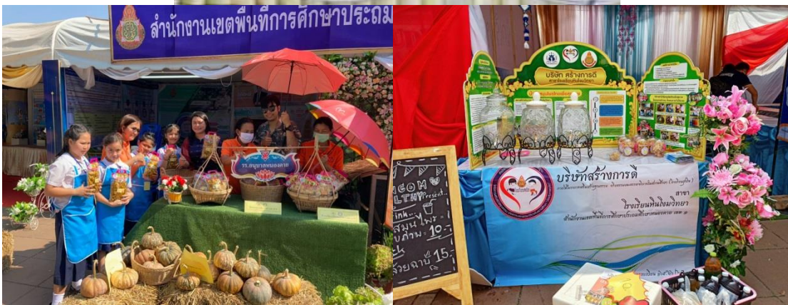
พิธีเปิดบริษัทสร้างการดี ณ สพป.นค.๑ เพื่อรวบรวมผลิตภัณฑ์และจำหน่ายให้โรงเรียน