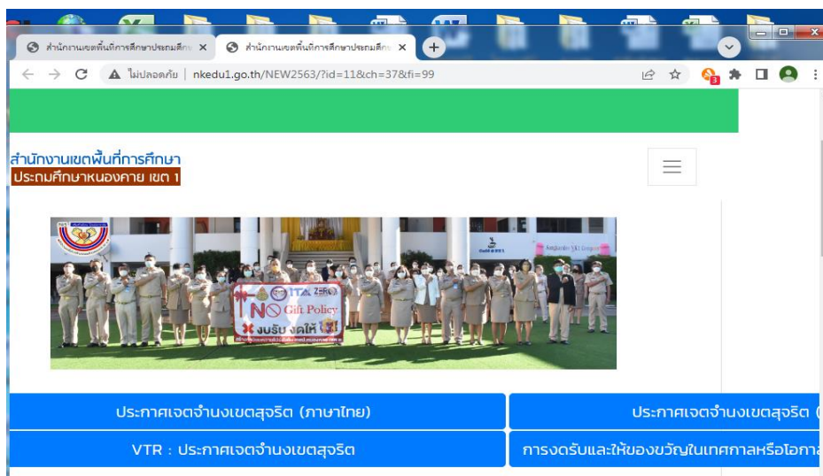
กิจกรรมค้นหาคนดีมีคุณธรรม