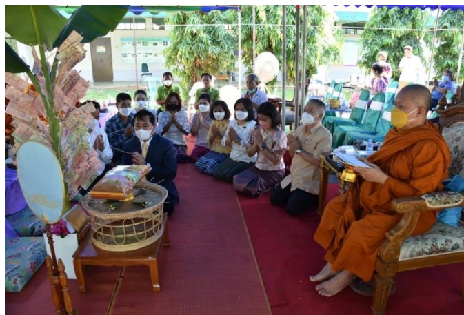
ทำบุญผ้าป่าการศึกษา

จัดประชุมเตรียมความพร้อมในการประเมินคุณธรรมและความโปร่งใสในการดำเนินงาน ให้กับสถานศึกษา จำนวน ๑๕๕ โรงเรียน ทางออนไลน์ ปี ๒๕๖๕