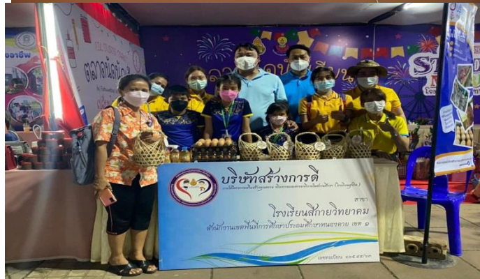
กิจกรรมส่งเสริมนักเรียนบริษัทสร้างการดี จำหน่ายผลิตภัณฑ์

จัดพิธีถวายสัตย์ปฏิญาณเพื่อเป็นข้าราชการที่ดีและพลังของแผ่นดินประจำปี ๒๕๖๕