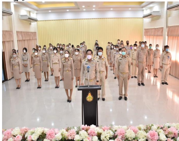
พิธีมอบรางวัลบุคลากรดีเด่น

จัดพิธีถวายสัตย์ปฏิญาณเพื่อเป็นข้าราชการที่ดีและพลังของแผ่นดินประจำปี ๒๕๖๕