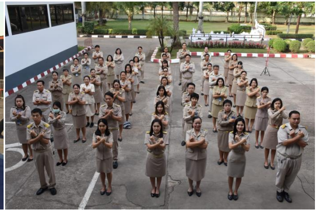
ผู้บริหาร สพป.หนองคาย ๑ ร่วมต่อต้านการทุจริตกับป.ช.หนองคาย