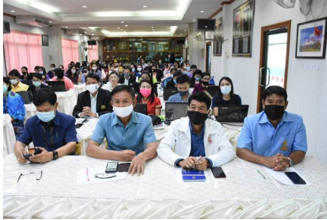
ประชุมครูผู้บริหารโรงเรียนสุจริต