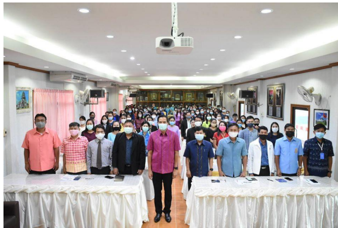
ศพ.หนองคาย เขต 1 อบรมเชิงปฏิบัติการ หลักสูตร “การจัดซื้อจัดจ้างด้วยวิธีการทางอิเล็กทรอนิกส์ และวิธีเฉพาะเจาะจง” วันศุกร์ที่ 6 มีนาคม พ.ศ. 2563 เวลา 08.30 น.